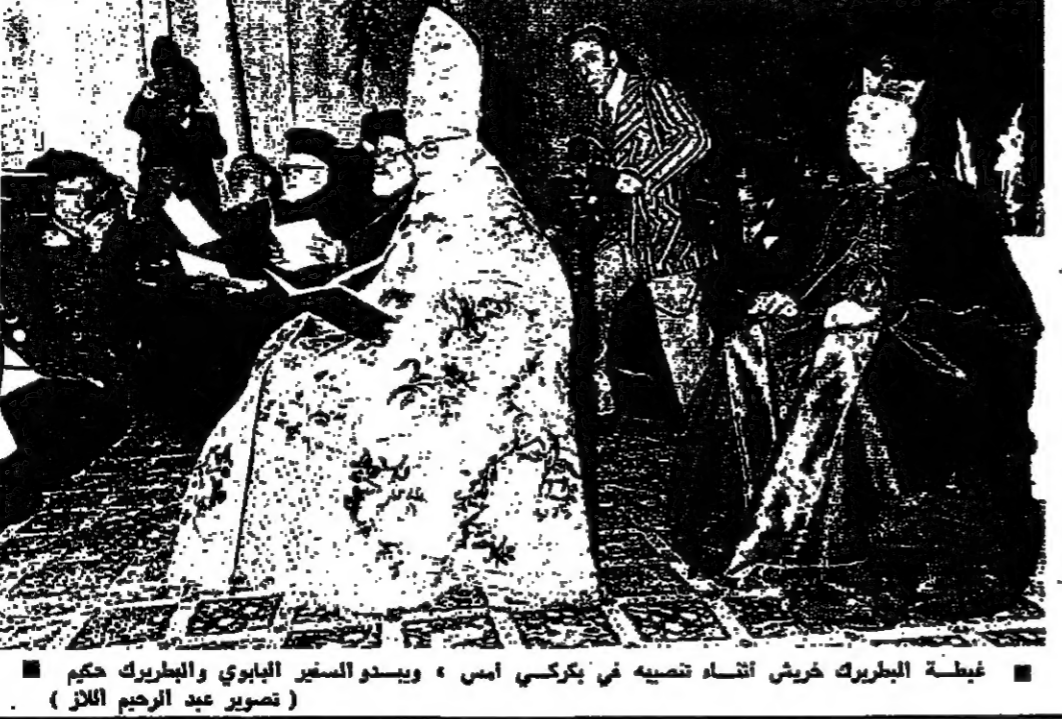
غبطة الطيريك خريش انتباه تصيبي في بركي امس ، ويبدو السفير الهادي والطيريك حكيم

جرى في احتفال كبير امس في بركي قبل ظهر امس ، تميم قبضة الطيريك انطونوس خريش بحضور الرئيس سليمان خريش ورئيس المجلس والحكومة والوزراء والنواب ، وممثلي القادة العرب وجماهير غفيرة من المواطنين . وقد التي الطيريك خطبا في الاحتفال قال فيه: ان نواتي، عندما يدعو داعي الوطن ، من ربح الصوت عليا حيث تعرف ان صوت الطيريكه يلقى الاذان الصغية ، نصرة للبنان وقضاياها ، وفيما هذا الشرق ، لا سيما الدول العربية الشقيقة ونسي طليعتها قضية فلسطين العادلة ، وشبهه ثورات هذا الوطن وللوايد الاخوية التي تشننا الى بسنا البيني .